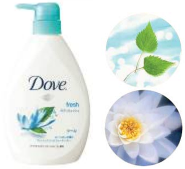
フレッシュミント&ウォーターリリー

go fresh シリーズ： ダヴ ボディウォッシュ クール 新鮮な気分になるフレッシュミントとウォーター リリーの清涼感のあるすっきりした香りです。 なめらかな泡立ちで、肌に大切なうるおいを与え つつ、ひんやりと洗い上げます。