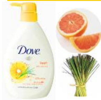
グレープフルーツ&レモングラス

go fresh シリーズ： ダヴ ボディウォッシュ リフレッシュ 心躍るグレープフルーツとレモングラスの フレッシュな香りです。なめらかな泡立ちで、 肌に大切なうるおいを与えつつ、さわやかに 洗い上げます。