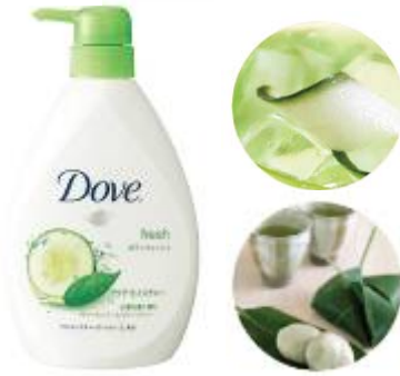
キューカンパー&グリーンティ

go fresh シリーズ： ダヴ ボディウォッシュ アクアモイスチャー 心落ち着くキューカンパーとグリーンティの 香りです。なめらかな泡立ちで、肌に大切な うるおいを与えつつ、軽やかに洗い上げます。