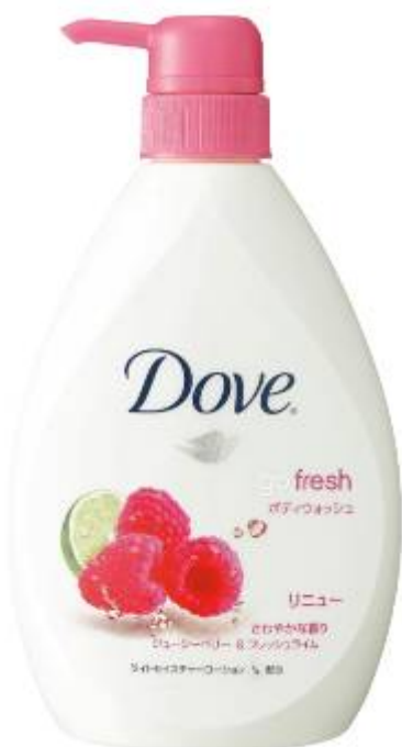
ジューシーベリー&フレッシュライム

go fresh シリーズ: ダヴ ボディウォッシュ リニュー ジューシーベリー&フレッシュライムの香り 内容量 550ml (つめかえ400ml) 価格 オープン価格 分類: シトラス・フルーティ・ウッディ 香り: さわやかな香り