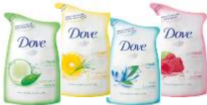
go fresh シリーズ：つめかえ用(4種) 内容量 400ml 価格 オープン価格

環境のことを考えて2個目からは「つめかえ用」を購入する方が多くなっています。新しいDove「go fresh」シリーズでは「つめかえ用」のパウチ層の構成を変更し、使用するプラチック量を従来品よりも11%削減。さらに環境にやさしい仕様に改良しています。